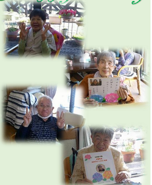
6月お誕生日を迎えられた4名 おめでとうございます♪