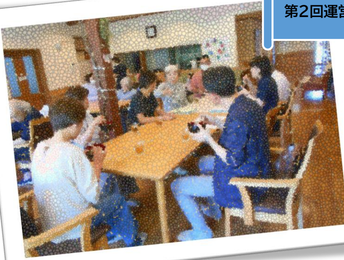
第2回運営推進会議

今のところはまだ、プランター菜園ですが、この中庭に、みんなで畑を作りたい計画をしています。