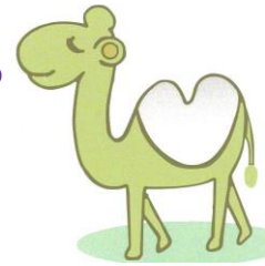
心地良いある日の午後