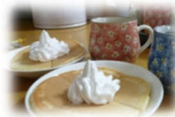
ホイップクリームものせていつもより豪華なホットケーキができました♪

部屋にはホットケーキの甘いにおいがプンプン。「これはいつ食べられるの～?」とすぐにでも食べたい気分でしたが、お茶の時間まではおあずけで残念!!